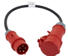
32A - 16A adapter