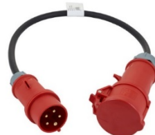
32A - 16A adapter