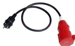
Villásdugó adapter 32 A